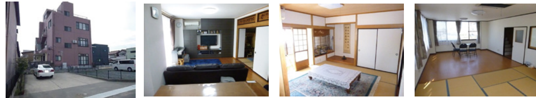
【交】三交バス「海蔵橋」停 徒歩2分【所】四日市市浜一色町【土】349.97㎡(105.86坪)【建延】257.83㎡(77.99坪) 【構】RC造4階建【築】昭和59年12月築 (仲介)